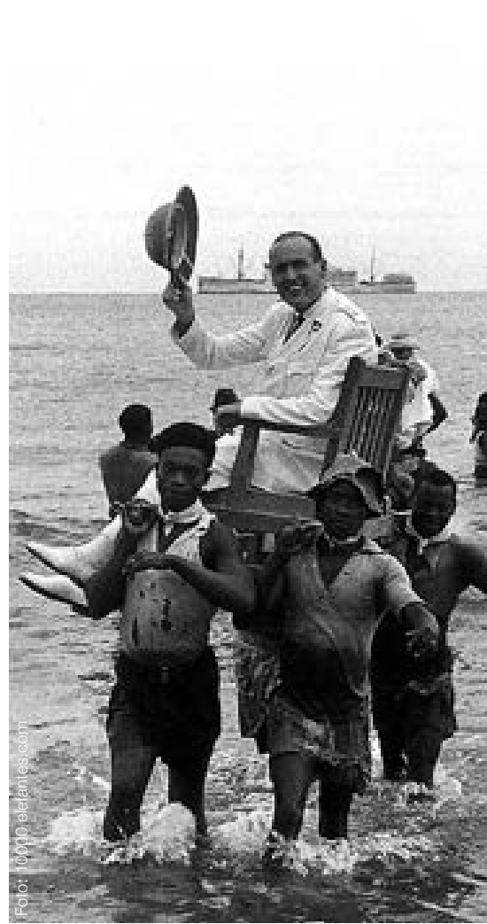
Espai Avinyó – Llengua i Cultura (c. Avinyó, 52)