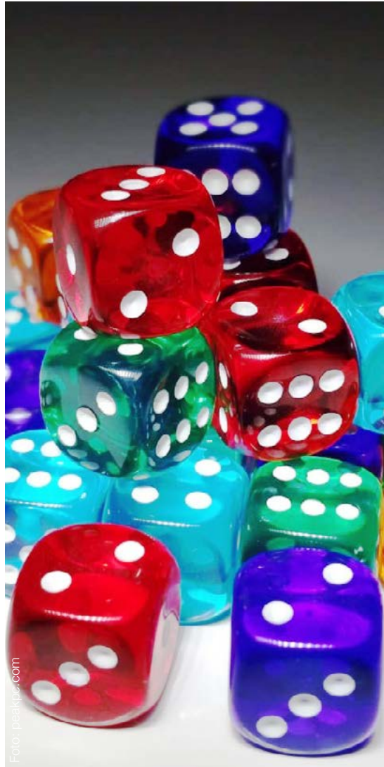
Espai Jove La Fontana (c. Gran de Gràcia, 190)